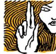
Hungarian Helsinki Committee